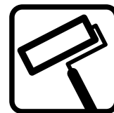
ADATTO PER RULLO