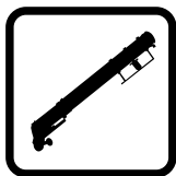
ADATTO PER BAZOOKA