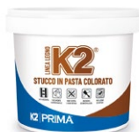
Barattolo da: 0,5 kg