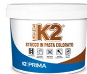
Barattolo da: 1 kg